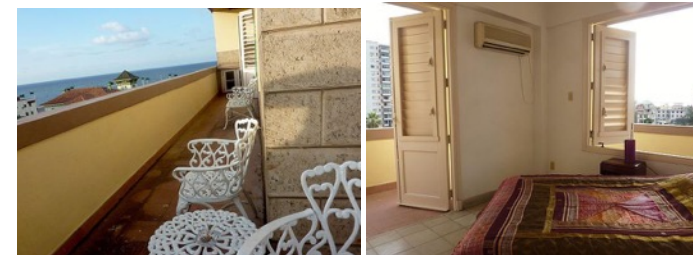
Casa 1: Calle I y 21/23